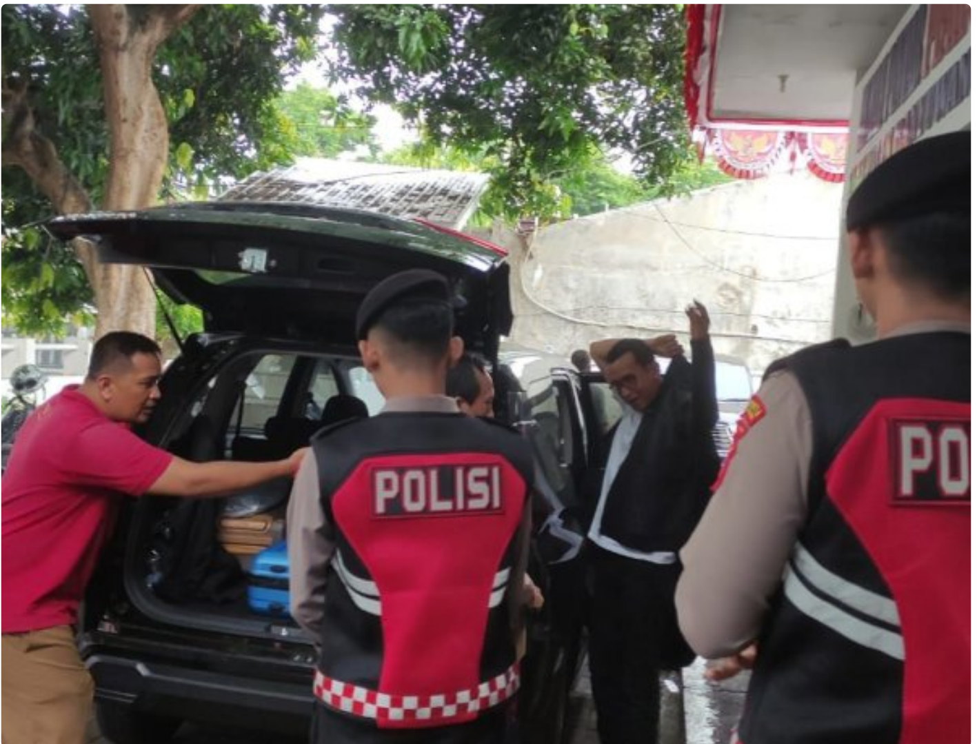
Personel Polresta Banyuwangi melakukan pengawalan ketat proses pengiriman hasil penghitungan surat suara Pilgub Jatim 2024 ke KPU Jatim

BANYUWANGI – Polresta Banyuwangi memberikan pengawalan ketat proses pengiriman hasil penghitungan surat suara Pilgub Jatim 2024 dari Kantor KPU